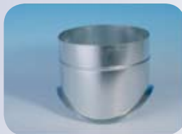
Nasadka siodłowa (formowana)