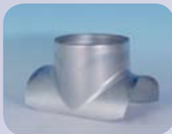
Nasadka siodłowa (prasowana)