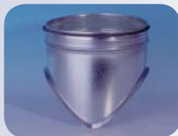
Nasadka siodłowa (formowana)