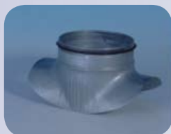
Nasadka siodłowa (prasowana)